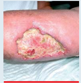
Abb. 10: Ulcus cruris, feuchte Restnekrosen, Fibrinbeläge und beginnende Granulation

fektionen und Unterminierungen lassen sich nicht erkennen, da der Wundgrund nicht einsehbar ist. Erst nachdem sie abgetragen sind, ist es möglich, den tatsächlichen Umfang und den Zustand der Wunde zu beurteilen.