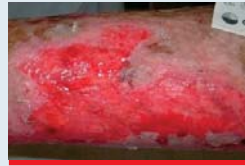
Abb. 8: Rosige Granulation, Ulcus cruris venosum, schuppige, trockene Umgebungshaut