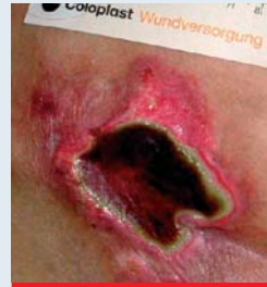
Abb. 4: Feuchte Nekrose in der Sakralregion