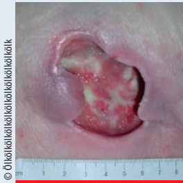
Abb. 1: Dekubitus Grad 3 mit Unterminierung, rosige Granulation und etwas Fibrinbelag