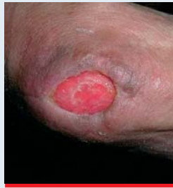
Abb. 7: Rosige Granulation, Ulzeration am Ellenbogen