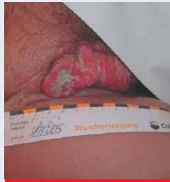
Abb. 2: Exulzierende, übelriechende Tumorwunde in der Leiste