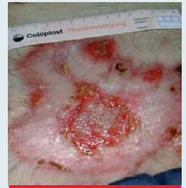
Abb. 5: Fortschreitende Epithelisierung bei z.n. Platzbauch

nulations- und Epithelisierungsphase, schützen die Wunde vor dem Eindringen von Keimen und Bakterien, gewährleisten den Gasaustausch, ermöglichen einen atraumatischen Verbandwechsel und schützen das empfindliche neue Gewebe in der Epithelisierungsphase. In jüngster Zeit sind Wundauflagen auf den Markt gekommen, die aktiv in den Heilungsprozess eingreifen. Diese Produkte sollen die Wunde nicht in erster Linie feucht halten, sondern die Abheilungsmechanismen unterstützen und beschleunigen. Sie enthalten Substanzen oder regen deren Produktion an, die einen entscheidenden Einfluss auf den Heilungsprozess haben bzw. ihn initiieren z.B. Kollagen, Silber, Hyaluronsäure und Wachstumsfaktoren.