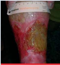
Abb. 6: Infiziertes Ulkus nach Honigbehandlung