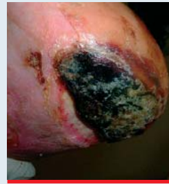
Abb. 9: Trockene Nekrose an der Ferse, beginnt vom Rand her aufzuweichen